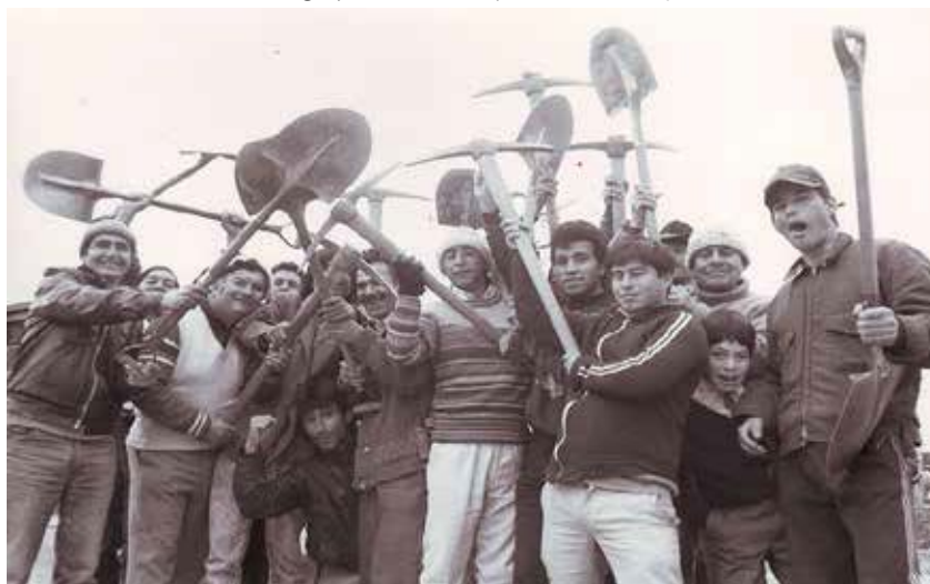
Fotografía n°1. Trabajadores del POJH