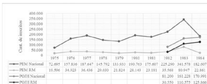
Gráfico n°1. Población inscrita en PEM y POJH

Fuente: INE - * Octubre - Diciembre / **Enero - Abril 16